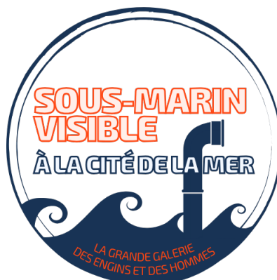
Maquette de la collection de La Cité de la Mer