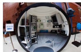
Vue intérieure en coupe de la sphère habitable de l' Archimède , à La Cité de la Mer

Construit pour descendre jusqu'à 11 000 mètres de profondeur, les concepteurs de l' Archimède veulent le voir tester ses limites et descendre dans une des fosses les plus profondes du monde. Le choix se porte sur la fosse des Kouriles au large du Japon, les Russes ayant estimé une profondeur supérieure à 10 000 mètres.