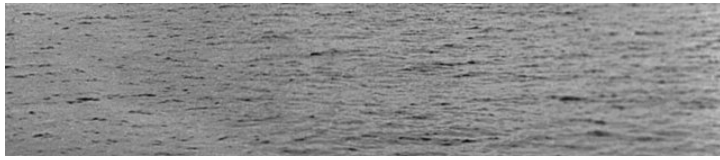
| L'USS Stewart en train de couler le 25 mai 1946