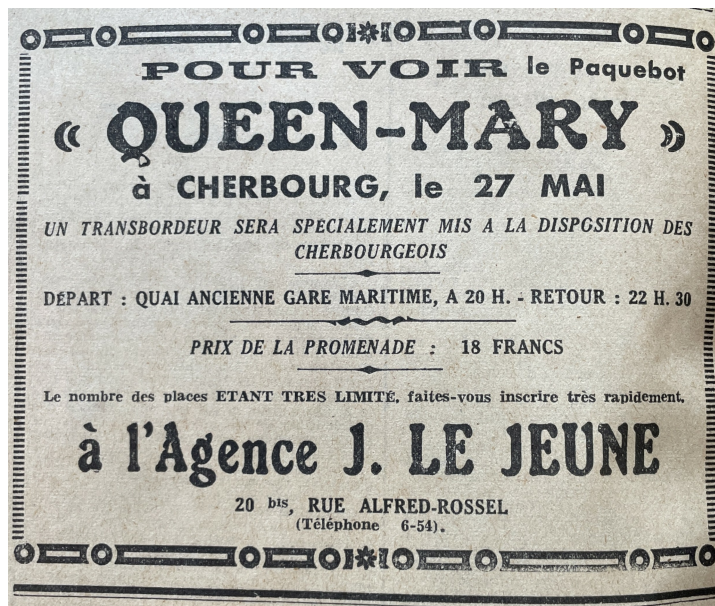
Publicité "Queen Mary" 1936

Le transbordeur La Bretonnière revient à la Gare Maritime Transatlantique avec deux sacs postaux mais aussi plus de 80 journalistes, photographes et cinéastes. À leur arrivée à la Gare Maritime Transatlantique, c'est l'effervescence. Les journalistes s'empressent de rejoindre les lignes télégraphiques et téléphoniques abondamment mises à leur disposition par le personnel des P. T. T. pour raconter leurs expériences lors de la traversée Southampton – Cherbourg. Certains d'entre eux quitteront la ville au petit matin à bord de l' Aquitania pour se rendre en Angleterre tandis que d'autres prendront le train transatlantique pour rejoindre Paris.