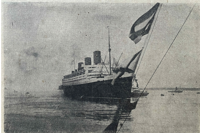
Le transatlantique anglais en rade de Cherbourg.

Londres. — La « Queen Mary » poursuit sa route avec une augmentation de vitesse très sensible. On s'attend à ce que la vitesse moyenne soit pour aujourd'hui de plus de trente nœuds. Le navire roule légèrement sur une mer relativement calme.