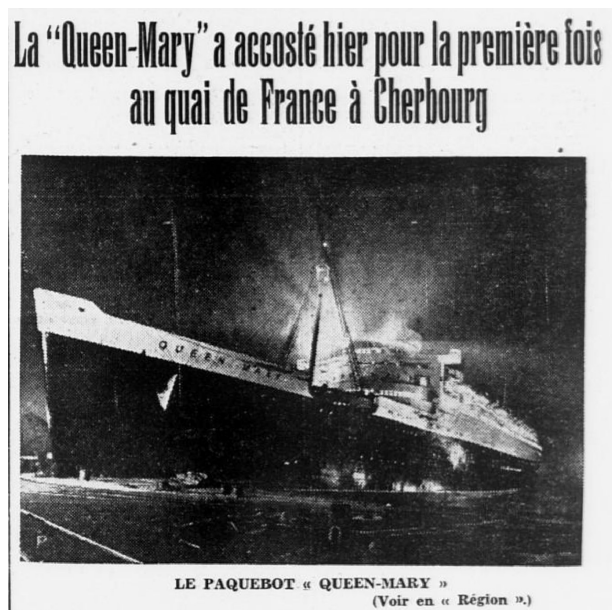
| L'escale du Queen Mary à Cherbourg, 14 avril 1937 - L'Ouest Eclair, 15 avril 1937

La première escale du Queen Mary à quai a donc lieu le 14 avril 1937. Annoncée dans La Presse cherbourgeoise , l'escale est un événement qui attire de nombreux curieux désireux de voir le paquebot de près. En temps normal, le Commissariat Spécial du Port délivre des « Laissez passez » aux curieux qui souhaitent accéder au Quai de France et à la Gare Maritime Transatlantique mais pour cette journée exceptionnelle, les accès sont interdits afin d'éviter trop d'encombrement. Les badauds sont ainsi invités à assister à l'arrivée et au départ du Queen Mary , en face, sur le Quai de Normandie.