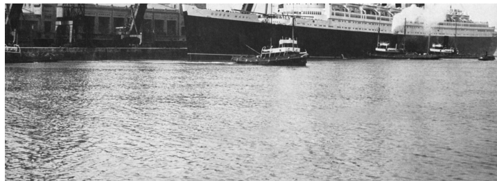
| Le Queen Mary au Quai de France © Collection Privée

La première escale du Queen Mary à quai a donc lieu le 14 avril 1937. Annoncée dans La Presse cherbourgeoise , l'escale est un événement qui attire de nombreux curieux désireux de voir le paquebot de près. En temps normal, le Commissariat Spécial du Port délivre des « Laissez passez » aux curieux qui souhaitent accéder au Quai de France et à la Gare Maritime Transatlantique mais pour cette journée exceptionnelle, les accès sont interdits afin d'éviter trop d'encombrement. Les badauds sont ainsi invités à assister à l'arrivée et au départ du Queen Mary , en face, sur le Quai de Normandie.