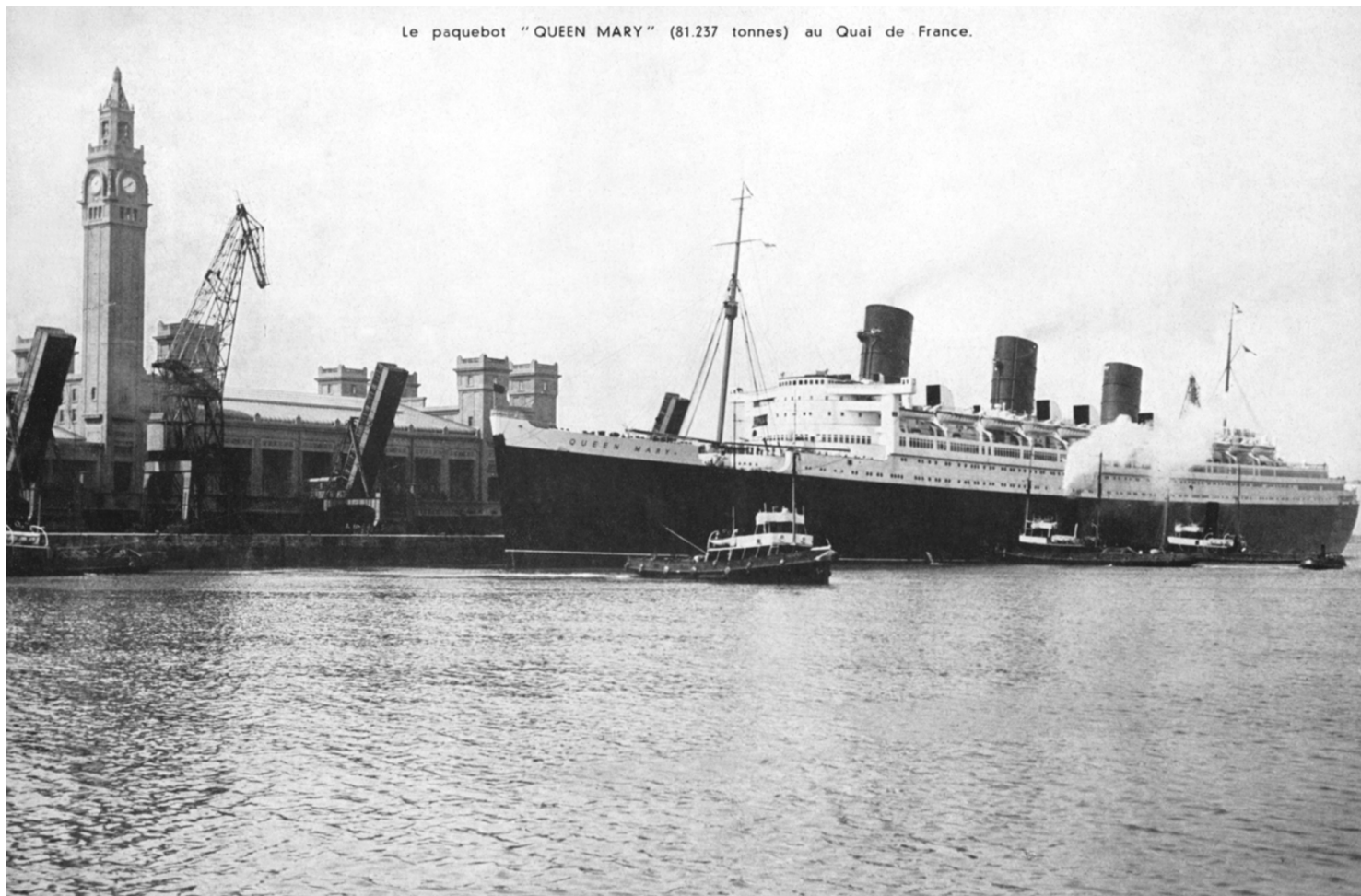
Le Queen Mary au Quai de France

La première escale du Queen Mary à quai a donc lieu le 14 avril 1937. Annoncée dans La Presse cherbourgeoise , l'escale est un événement qui attire de nombreux curieux désireux de voir le paquebot de près. En temps normal, le Commissariat Spécial du Port délivre des « Laisser passez » aux curieux qui souhaitent accéder au Quai de France et à la Gare Maritime Transatlantique mais pour cette journée exceptionnelle, les accès sont interdits afin d'éviter trop d'encombrement. Les badauds sont ainsi invités à assister à l'arrivée et au départ du Queen Mary , en face, sur le Quai de Normandie.