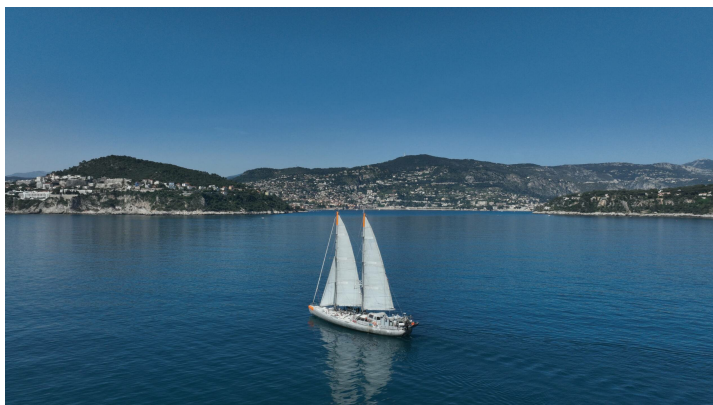
La goélette Tara en navigation au large de Nice pendant l'expédition Tara Europa

Pour en savoir plus sur l'expédition Tara Europa, rendez-vous sur le site de la Fondation Tara Océan .