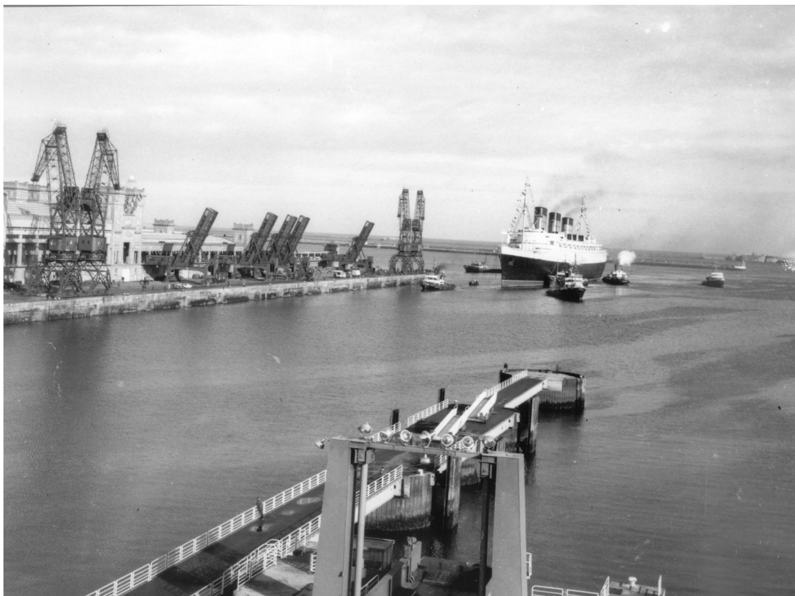
| Escale du Queen Mary