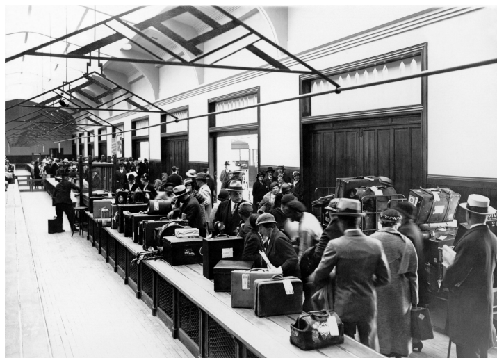
La salle des douanes

Ce sont les passagers les moins riches. Ils subissent un contrôle d'identité par les services de police et un contrôle sanitaire en salle médicale.