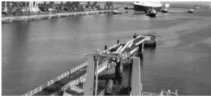
| Escale du Queen Mary