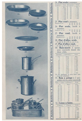
Extrait du catalogue de matériel culinaire Dehillerin, Paris

La cuisine dispose d'une grande cuisinière et de rôtisseries .