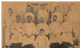
Quelques membres du personnel des cuisines du Titanic

Les plats des 1re et 2e classes sont préparés dans la même cuisine. Celle-ci est divisée en sections, chacune étant spécialisée dans la préparation d'un plat spécifique.