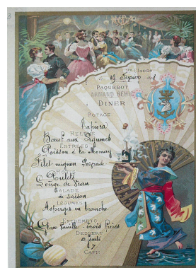
Menu du dîner du 19 février 1898 servi à bord du paquebot Armand Béhic @ Musée de la Part

Le rôti de bœuf proposé au dîner du 14 avril 1912 est en effet accompagné du jus de viande