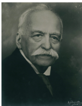
| Auguste Escoffier

Auguste ESCOFFIER (1846-1935) est un cuisinier français. Il a été surnommé le roi des cuisines, le cuisinier des rois .