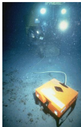
ROBIN : ROBOT d'Inspection du Nautile

Le nombre de fuites identifiées est porté à vingt : onze sur la partie avant, et neuf sur la partie arrière. Des interventions effectuées permettent le colmatage de 6 fuites de façon totale. Le débit des fuites estimé à 125 tonnes par jour au début des opérations semble être réduit à moins de 80 tonnes/jour.