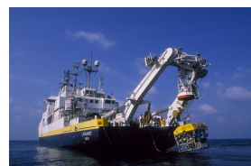
Mise à l'eau du robot téléopéré Victor 6000

Enfin, il est nommé chef de quart sur le Victor 6000 .