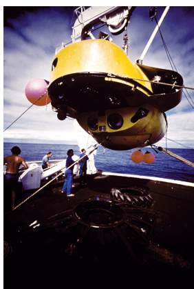
Mise à l'eau de Cyana

À la demande du gouvernement espagnol, Ifremer et la Sasemar (Société espagnole de sécurité et de sauvetage en mer) ont signé le 5 mai 2003 un contrat portant sur la mise à disposition du sous-marin Nautile pour le contrôle de l'état de l'épave du Prestige et de l'étanchéité de l'ensemble des fuites traitées. Ces dernières opérations seront réalisées lors de PRESTINAUT II qui aura lieu du 24 mai au 6 juin 2003.