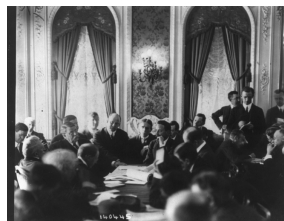
Commission d'enquête américaine

La commission d'enquête américaine s'ouvre le 19 avril 1912.