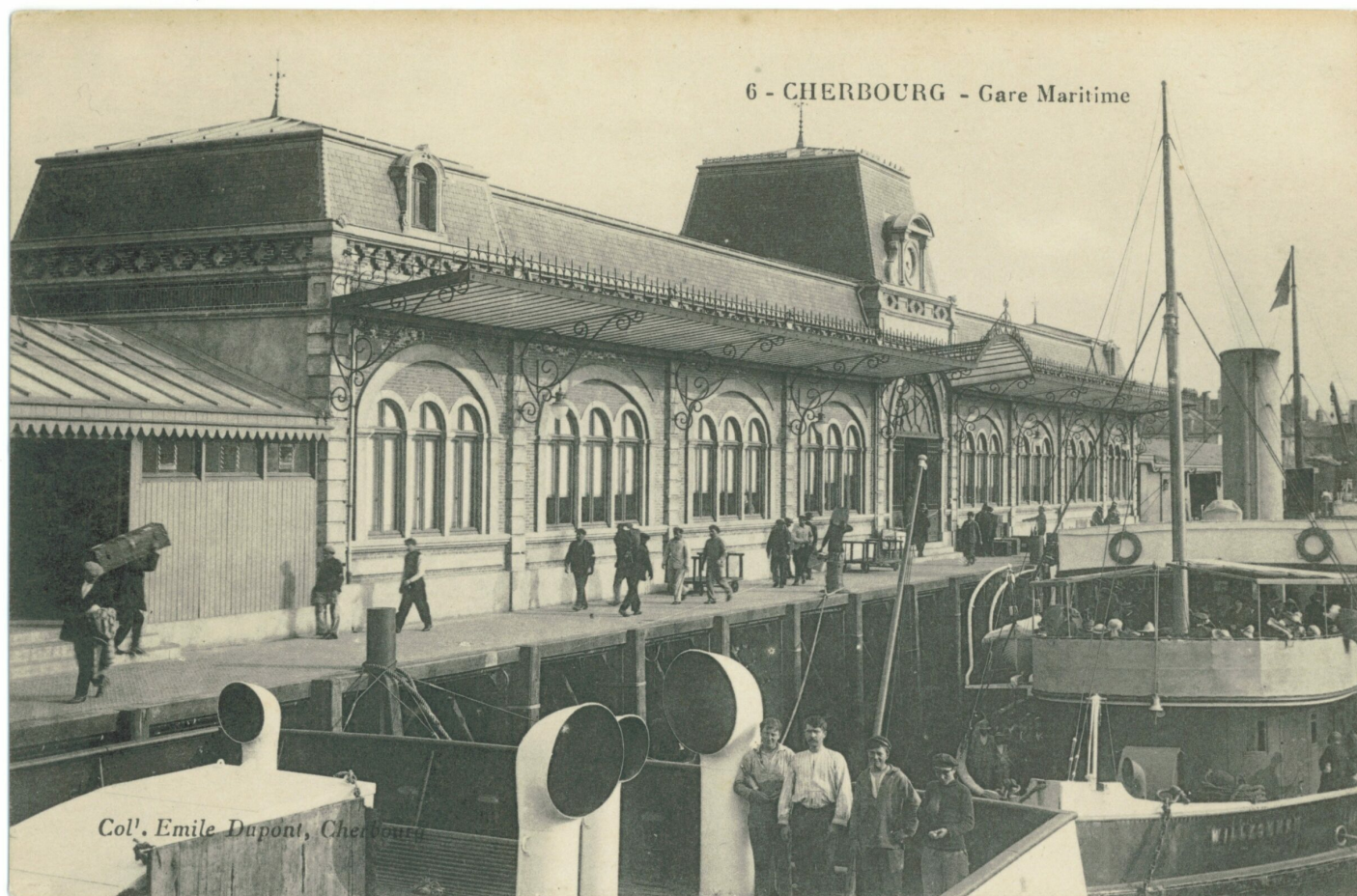
La Gare Maritime de 1912 dans laquelle Joséphine a transité avant de prendre le train pour Paris

La troupe se rend à Paris pour participer à la « Revue nègre » présentée au Théâtre des Champs-Élysées. Le 2 octobre, Joséphine BAKER entre en scène en première partie. Elle danse le charleston dans une scène appelée « La Danse sauvage » qu'elle interprète vêtue d'un simple pagne et de fausses bananes, rythmée par des tambours. C'est un succès.