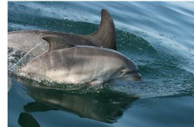
Grands dauphins dans la mer de la Manche

Des animaux marins vivent à la surface, là où il y a de la lumière.