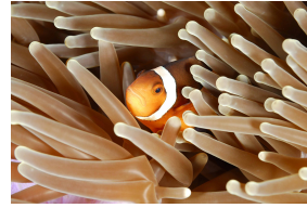
Poisson clown

Des animaux marins vivent dans les eaux chaudes.