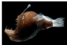
Baudroie abyssale de Johnson ( Melanocetus johnsonii ) femelle

Des animaux vivent dans les profondeurs, là où il fait sombre.