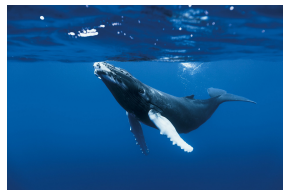
Baleine à bosse