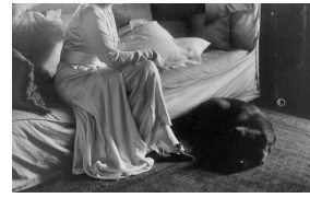
Lady DUFF GORDON en 1916

En 1924, sa maison de couture encourt des pénalités pour pratiques commerciales non réglementaires. À partir des années 1930, l'entreprise décline ce qui entraîne la fermeture de la « Maison Lucile ».