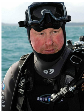
Michel L'Hour

À l'âge de 13 ans, admiratif des chantiers navals, il rêve de devenir pilote dans l'aéronavale tout en se nourrissant de livres d'Histoire.