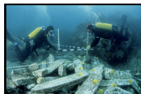
Gisement de plomb antique de l'épave de Ploumanac'h

Elle gît par 10 mètres de fond, dans une zone où la houle et le courant n'ont pas facilité les recherches. Expertisée par le DRASSM de 1983 à 1986, l'épave présente un intérêt archéologique certain, notamment par son chargement de lingots de plomb, témoignage matériel du commerce maritime des matières premières en Manche dans l'Antiquité.