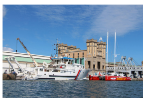
L'André Malraux devant la Gare Maritime Transatlantique de Cherbourg-en-Cotentin

L'André Malraux, navire doté des dernières technologies et respectueux de l'environnement, est destiné à servir de support de plongée humaine et robotisée pour des campagnes de protection des biens culturels maritimes français et de recherche en archéologie sous-marine (prospections, expertises, fouilles)