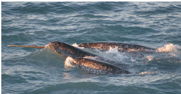
| Un groupe de narvals