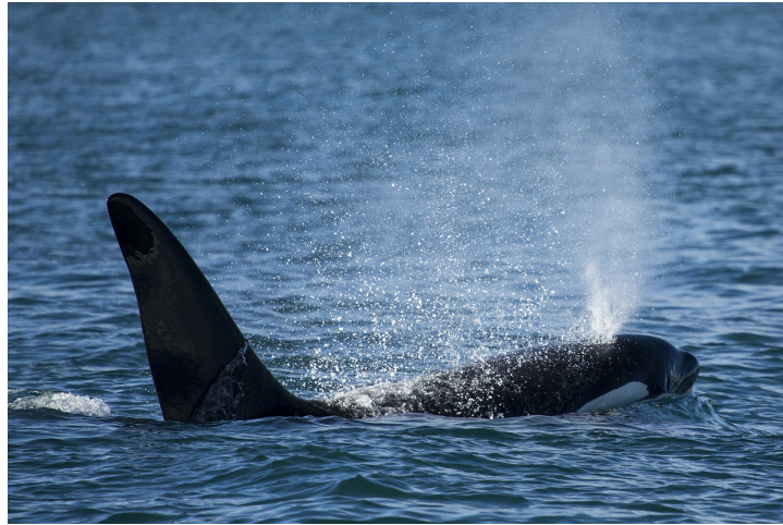
| Souffle d'une orque

La maman allait son petit pendant environ 1 an.