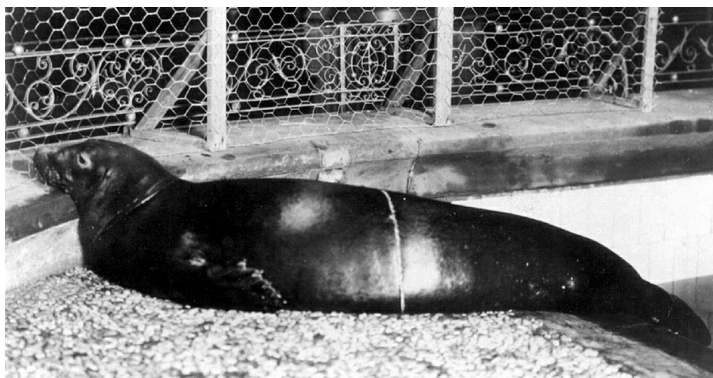
Phoque moine des Caraïbes captif, Monachus tropicalis , de sexe inconnu à l'aquarium de New York vers 1910. Le spécimen a été capturé à l'origine à Arrecife's Triángulos (Campeche) ou à Arrecife Alacra'n (Yucatan) au Mexique (Townsend 1909).

Les bébés naissent tout noirs puis perdent leur couleur en grandissant.