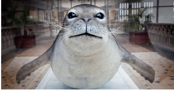
Statue visible à La Cité de la Mer, en haut des escaliers dans la Nef d'accueil