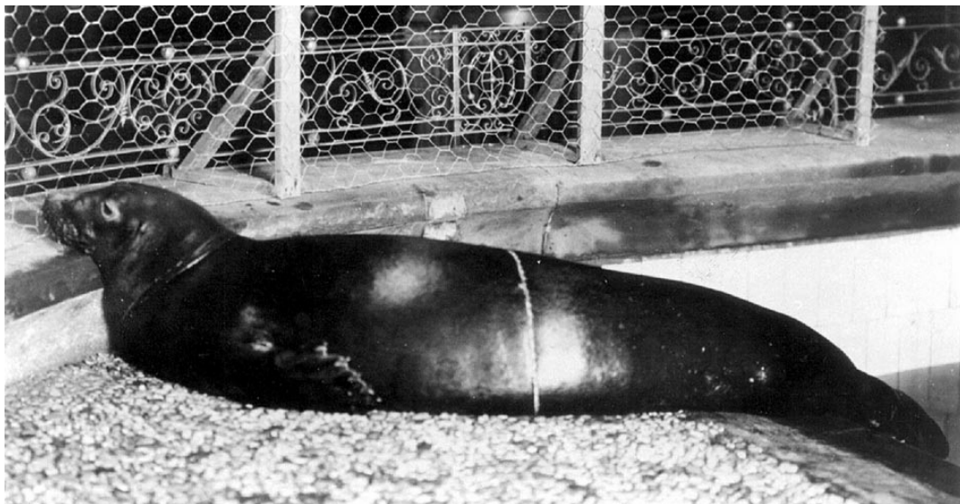
Phoque moine des Caraïbes captif, Monachus tropicalis , de sexe inconnu à l'aquarium de New York vers 1910. Le spécimen a été capturé à l'origine à Arrecife's Triángulos (Campeche) ou à Arrecife Alacra'n (Yucatan) au Mexique (Townsend 1909).

Les bébés naissaient tout noirs puis perdaient leur couleur en grandissant.