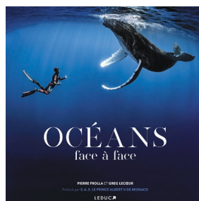
| Affiche du projet "Océan" © Pierre FROLLA

De septembre 2020 à avril 2021, Pierre FROLLA lance son projet artistique « Le cœur de l'Océan », afin de témoigner de la communion entre l'homme libre et l'animal marin.