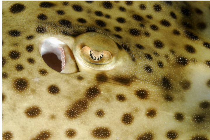
| Gros plan sur un œil de raie brunette.

On distingue le mâle de la femelle grâce aux ptérygopodes : ce sont les organes reproducteurs du mâle. Les ptérygopodes se situent à la base de la queue.