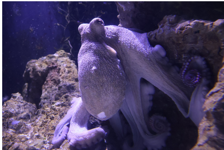
| Poulpe commun

Les tentacules* sont indépendants les uns des autres. Le poulpe peut bouger un seul tentacule* à la fois et dans tous les sens.