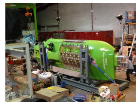
Le DEEPSEA CHALLENGER en construction

Ron ALLUM remplace également l'huile minérale classique contenue dans les boîtiers des batteries par une huile en silicone inflammable permettant à l'électronique d'être exposé à de hautes pressions sans entrer en contact direct avec l'eau de mer. Cette technique évite ainsi de construire des boîtiers lourds