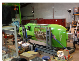
Le DEEPSEA CHALLENGER en construction

Ron ALLUM remplace également l'huile minérale classique contenue dans les boîtiers des batteries par une huile en silicone inflammable permettant à l'électronique d'être exposé à de hautes pressions sans entrer en contact direct avec l'eau de mer. Cette technique évite ainsi de construire des boîtiers lourds