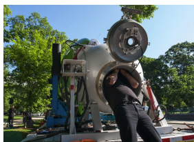
James Cameron travaillant sur la sphère habitable du sous-marin Deepsea Challenger, à Capital Hill Washington D.C le