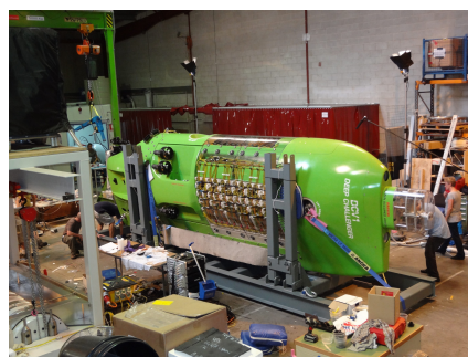
Le DEEPSEA CHALLENGER en construction

Ron ALLUM remplace également l'huile minérale classique contenue dans les boîtiers des batteries par une huile en silicone inflammable permettant à l'électronique d'être exposé à de hautes pressions sans entrer en contact direct avec l'eau de mer. Cette technique évite ainsi de construire des boîtiers lourds