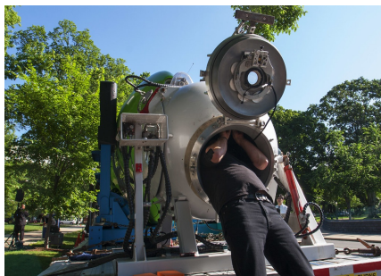
James Cameron travaillant sur la sphère habitable du sous-marin Deepsea Challenger, à Capitol Hill, Washington, DC le 11 juin 2013.

forme cylindrique. La sphère ne doit pas excéder 109 centimètres afin de limiter le poids de celle-ci et par la même occasion le poids de l'engin.