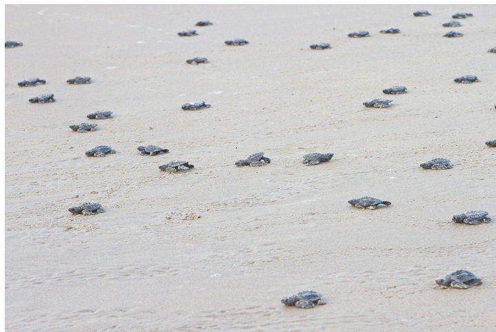
Remise en liberté de nouveau-nés tortue de Kemp à Laguna Atascosa en partenariat avec Sea Turtle Rescue.

Elle utilise un mode de ponte collective nommé « arribada »: plusieurs centaines de femelles se réunissent pour pondre ensemble sur une même plage, la plupart du temps dans le Golfe du Mexique.