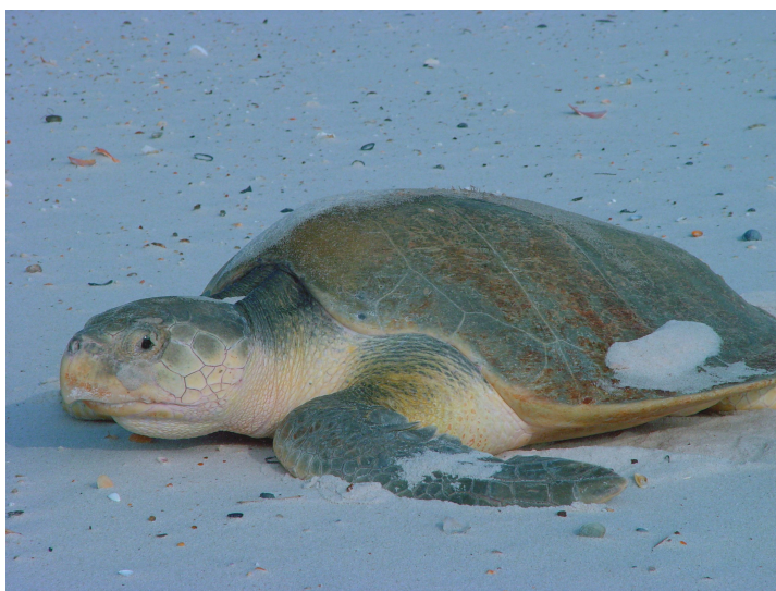
| Une tortue de Kemp, espèce menacée, se prélassait au soleil sur la plage.

En janvier 2007, une tortue de Kemp a été retrouvée sans vie sur la plage de Saint-Germain-sur-Ay, Manche. Cet événement pourrait constituer un premier indice des effets du réchauffement climatique et des changements dans la dynamique des courants marins.