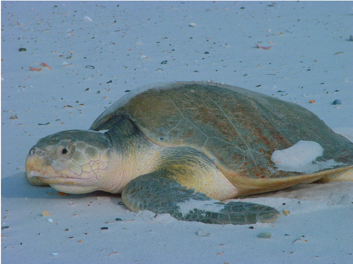
| Une tortue de Kemp, espèce menacée, se prélassait au soleil sur la plage.

En janvier 2007, une tortue de Kemp a été retrouvée sans vie sur la plage de Saint-Germain-sur-Ay, Manche. Cet événement pourrait constituer un premier indice des effets du réchauffement climatique et des changements dans la dynamique des courants marins.