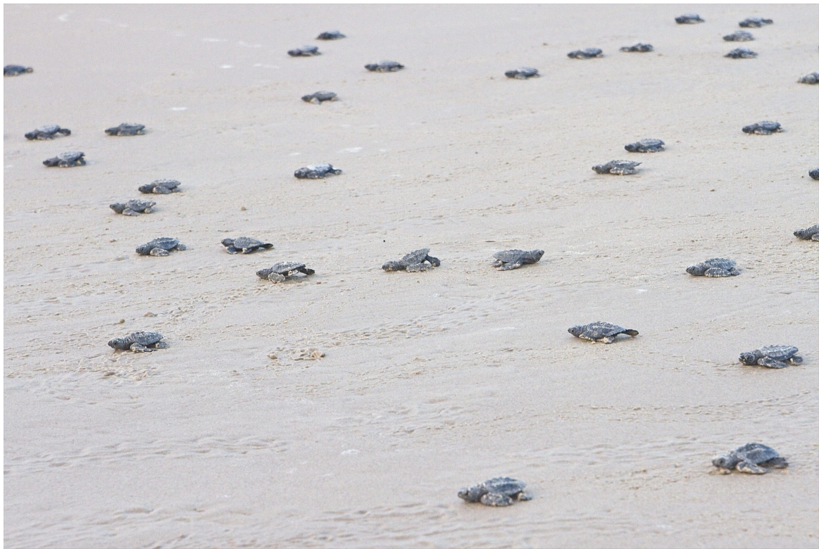
Remise en liberté de nouveau-nés tortue de Kemp à Laguna Atascosa en partenariat avec Sea Turtle Rescue.