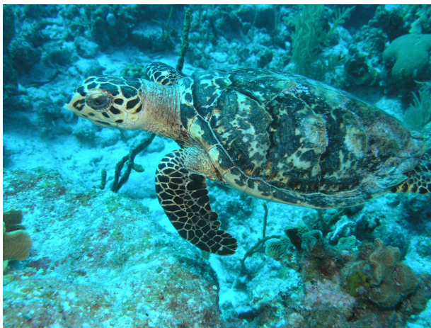
Une tortue imbriquée nage dans l'océan.