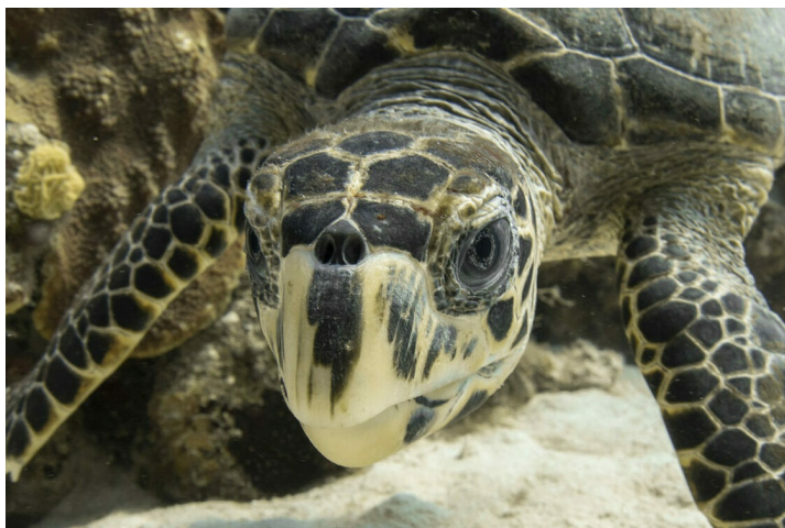
Une tortue imbriquée dans l'océan. On distingue clairement ses deux paires d'écailles préfrontales.

La tortue imbriquée est une espèce migratrice* : elle revient sur sa plage de naissance pour pondre ses œufs une fois adulte.