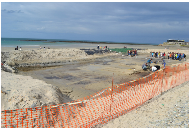
Le chantier de fouilles, 2011

À l'époque des Gaulois, le village se trouve aux portes de la plage, entouré de prairies et de parcelles cultivées.