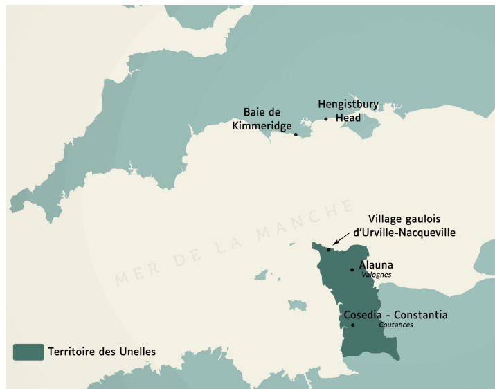
Le village d'Urville-Nacqueville et ses relations avec l'Angleterre

Et certains anglais se sont installés définitivement dans le Cotentin !