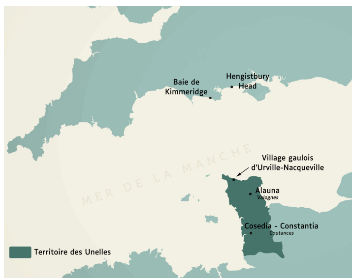
Le village d'Urville-Nacqueville et ses relations avec l'Angleterre

Et certains anglais se sont installés définitivement dans le Cotentin !