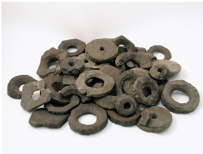
Anneaux de lignite découverts entre la fin du XIXe et le début du XXe siècle