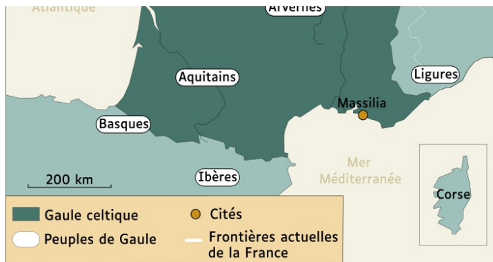
La Gaule entre le VIIe et Ier siècle avant notre ère

Appelés celtes dans leur langue, ils sont baptisés « Gaulois » par les Romains.