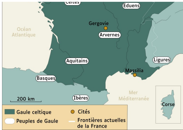
La Gaule entre le VIIe et Ier siècle avant notre ère

Appelés celtes dans leur langue, ils sont baptisés « Gaulois » par les Romains.