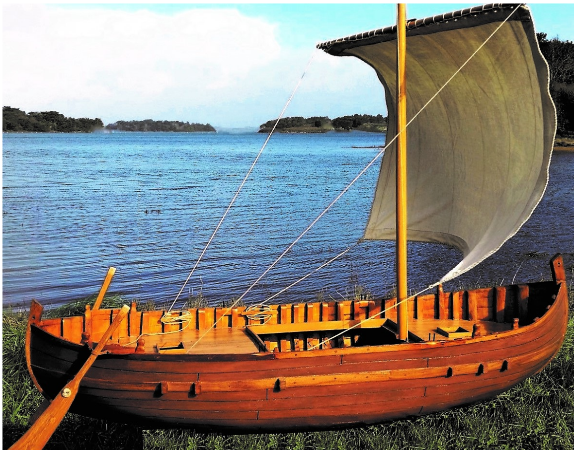
Navire Vénète