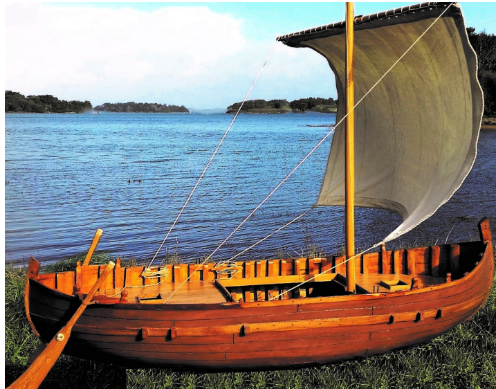
| Navire Vénète