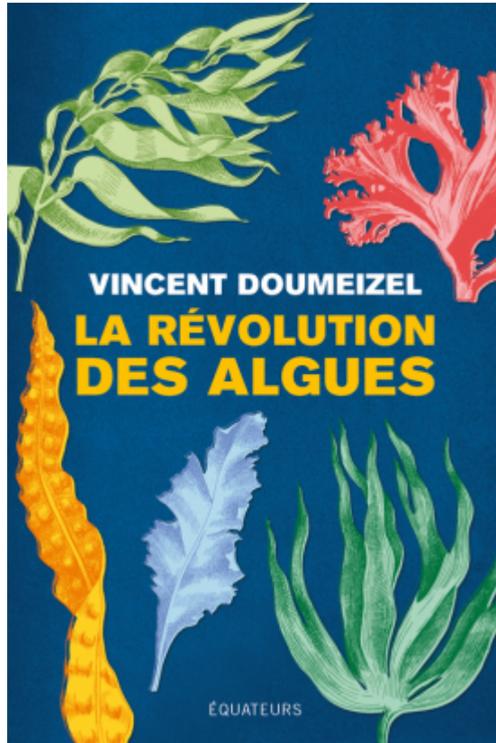
| L'essai "La révolution des algues"