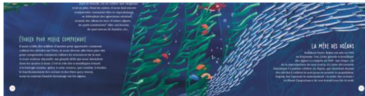
| Extrait du livre jeunesse "Comment les algues peuvent sauver le monde"