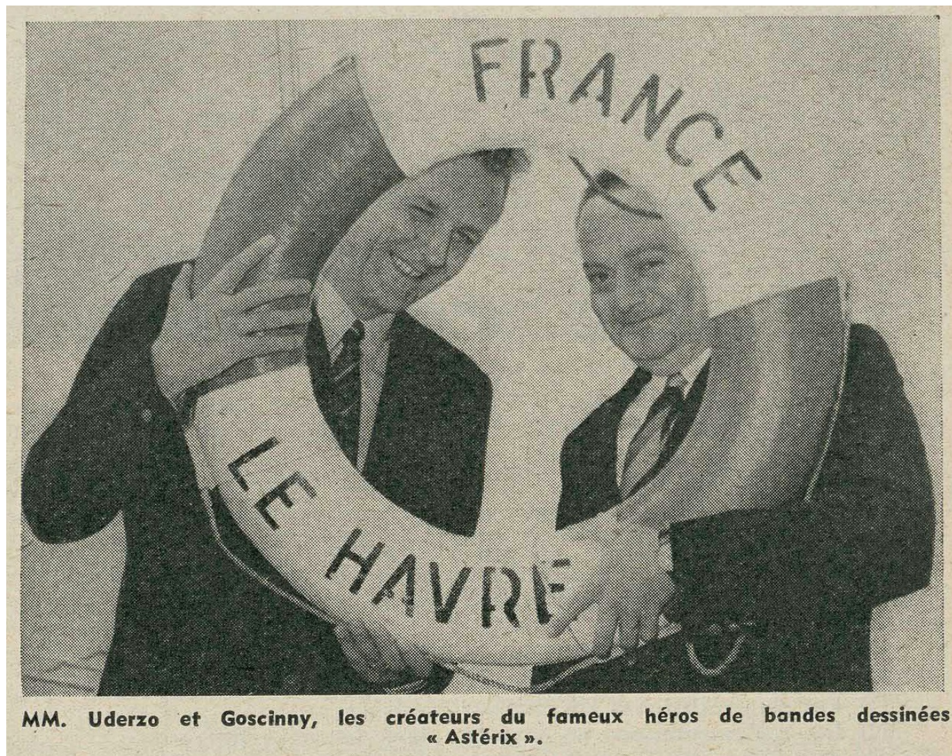
MM. Uderzo et Goscinny, les créateurs du fameux héros de bandes dessinées « Astérix ».

Un voyage transatlantique très inspirant !