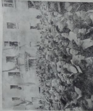
La foule cherbourgeoise devant l'Hôtel de Ville