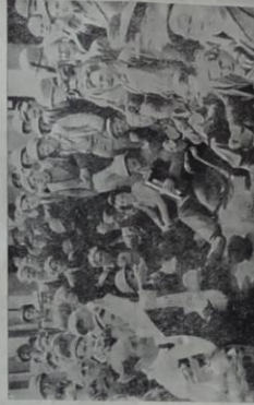
Dans le port de Cherbourg les manifestations prennent un caractère moins officiel