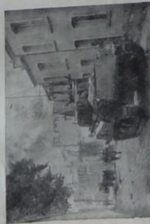
Un des premiers chars alliés pénétrant dans Cherbourg