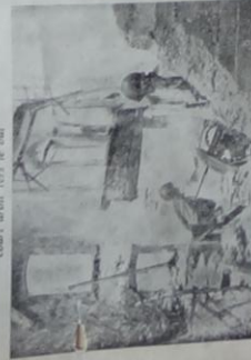
Dans la ville le combat se poursuit. Operation de nettoyage