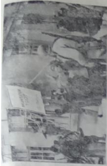
"A moi, l'air!" Les Français et les Américains célèbrent à sa "désoccupation"