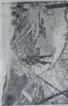
L'infanterie américaine pénètre les défilés extrêmes de la ville