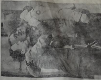
Un accueil enthousiaste