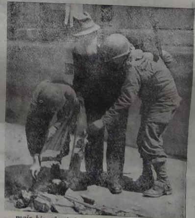
. . . mais bientôt il disparaîtra comme à Cherbourg où ce vieux patriote achève de le réduire en cendres