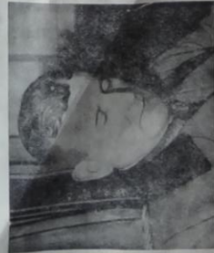
(Cherbourg) Le général von S. (à gauche), commandant de la garnison allemande et (à droite) le général Stalder, son commandant en second, après leur capitulation