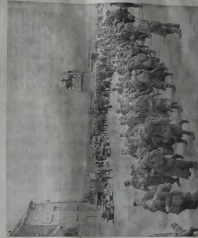
En 1928 ces soldats allemands défilent sur la place Napoléon. Sous les yeux de l'Américain qui semble mépriser l'exécution pénale, ont prisonniers allemands défilent à leur tour