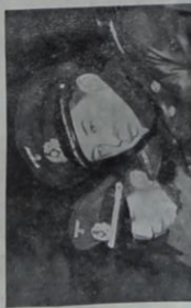
Le correspondant américain, chef de la Défense maritime, fait présenter par les Alliés