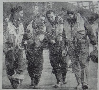
DANS LES AIRS: Quatre aviateurs français retour d'une mission contre la forteresse d'Hitler