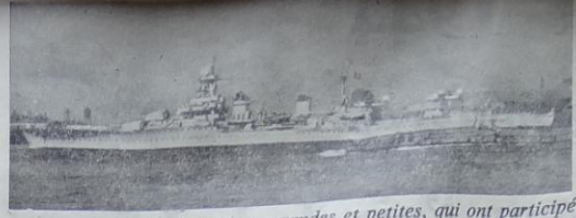
Parmi les unités françaises, grandes et petites, qui ont participé aux opérations devant Cherbourg, se trouvait le Georges Leygues, qui l'an dernier s'est déjà distingué dans l'Atlantique sud