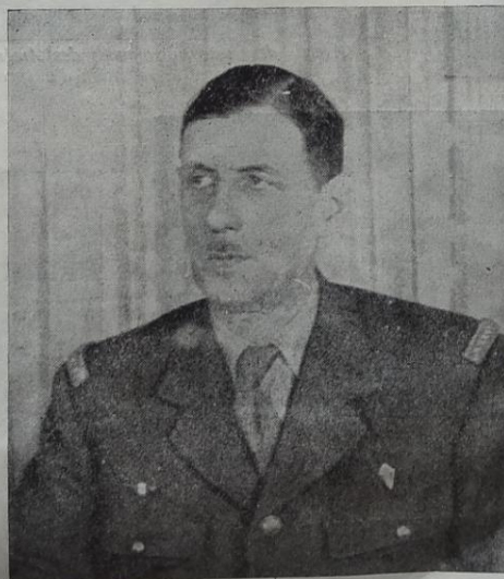
" Si donc le 14 Juillet 1940 est un jour de deuil pour la Patrie, ce doit être en même temps une journée de sourde espérance. Oui, la victoire sera remportée. Et elle le sera, j'en répons, avec le concours des armes de la France." De Gaulle, 13.7.40