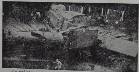
Le sabotage des communications entrave grandement l'exécution du plan ennemi et retarde l'arrivée des renforts

Aujourd'hui Cherbourg Bientôt toute la France