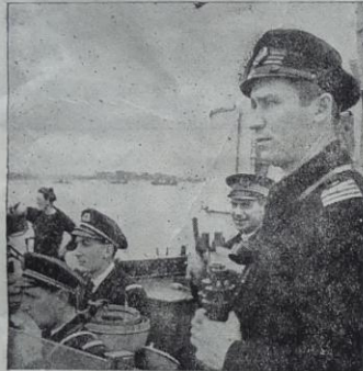
...SUR MER: Sur le pont de la frégate La Surprise, face aux côtes françaises