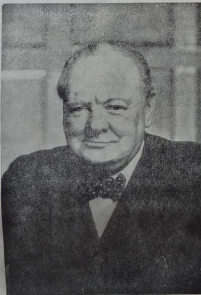
" Je proclame ma foi que beaucoup d'entre nous verront un 14 Juillet où une France libérée se réjouira une fois de plus dans sa grandeur et sa gloire, au premier rang des champions de la liberté et des droits de l'homme." Churchill, 14.7.40