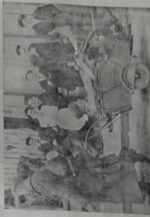
Un développement qui fait plaisir