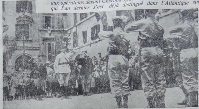
. . . tandis qu'à Rome le général Juin salue les couleurs de ses troupes victorieuses