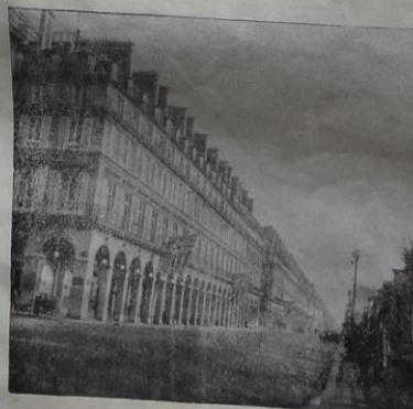
Le drapeau allemand flotte encore sur Paris qui attend et espère . . .

Aujourd'hui Cherbourg Bientôt toute la France