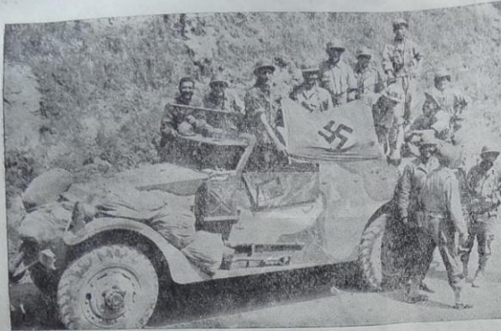
En Italie, des Français montrent fièrement une bannière qu'ils ont enlevée au cours de la prise d'Esperia . . .