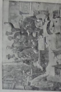
Sur une colline élevée d'innombrables Cherbourgeois célèbrent une foule enthousiaste à travers la ville