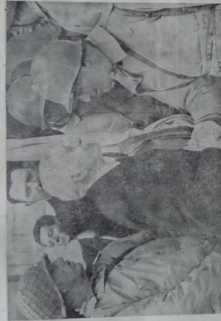
Prévenant le Dr. Brandt de son succès, le général Collins a déclaré: "C'est un plaisir de pouvoir dire aux Français: 'Voilà votre première grande ville à vous être rendue'"