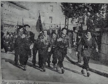
Sur toute l'étendue du territoire, ceux du Maquis, par leur action héroïque, immobilisent des troupes dont l'absence sur le front est cruellement ressentie par l'ennemi

"Moi-même et ceux qui servent sous mes ordres apprécient et respectent profondément le courage et l'habileté dont font preuve les forces françaises de la Résistance à l'intérieur de la France. Leurs opérations et leur activité jouent un rôle des plus précieux dans les opérations et dans la libération de leur sol natal. Lorsque la bataille aura été gagnée et l'Allemagne vaincue, le rôle des soldats français de la Résistance sera rendu public et jugé, j'en suis sûr, digne des plus hautes traditions dans la longue histoire de l'Armée française."