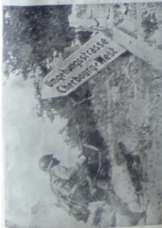
Méprisant l'instruction allemande ce fantassin américain court droit vers le but