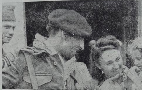
SUR TERRE: Un Commando français qui débarqua en Normandie parmi les premiers