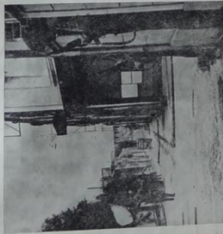
Avertis des ruses allemandes des Américains attendent avec méfiance la reddition d'un groupe ennemi